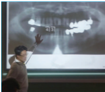
欠損症例の模擬診察の講義(前回コースから)